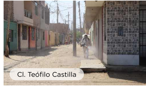
Cl. Teófilo Castilla