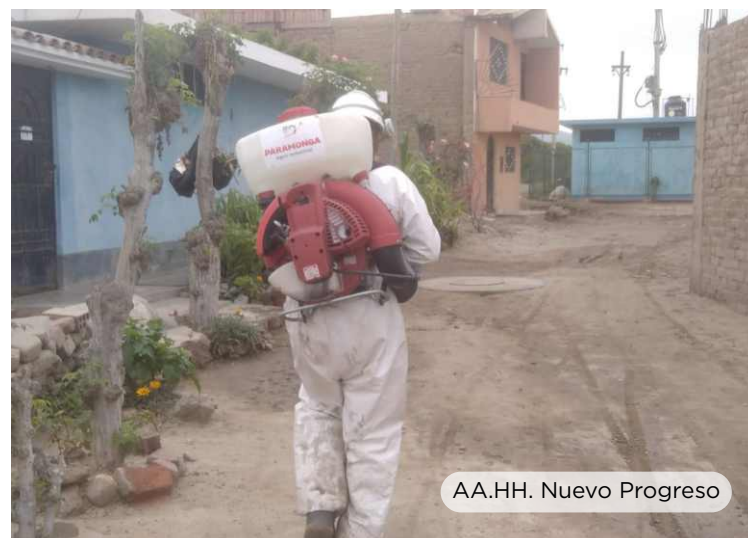
AA.HH. Nuevo Progreso