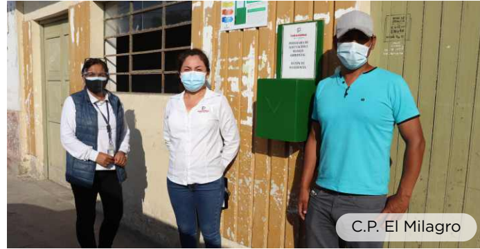
C.P. El Milagro