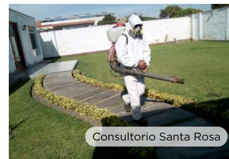
Consultorio Santa Rosa