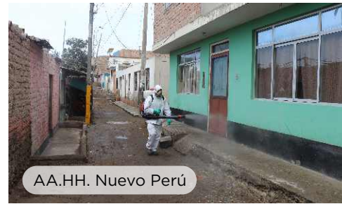
AA.HH. Nuevo Perú

se ha logrado gracias a la predisposición por parte de la empresa y la buena coordinación del Departamento de Relaciones Comunitarias con los representantes de cada asentamiento humano, urbanización o centro poblado a donde acude nuestro equipo de desinfecciones, recorriendo todas las calles con motomochilas que liberan ácido peracético, producto aprobado y autorizado por las instituciones correspondientes para realizar esta labor.