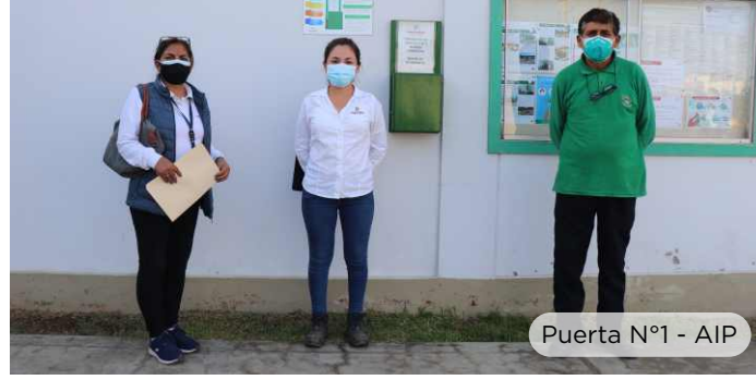
Puerta N°1 - AIP