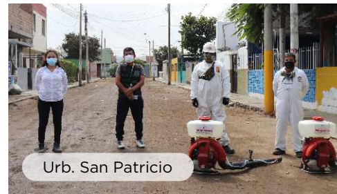
Urb. San Patricio