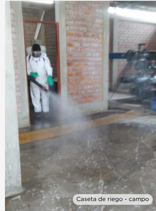
Caseta de riego - campo