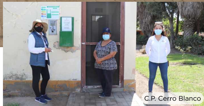
C.P. Cerro Blanco