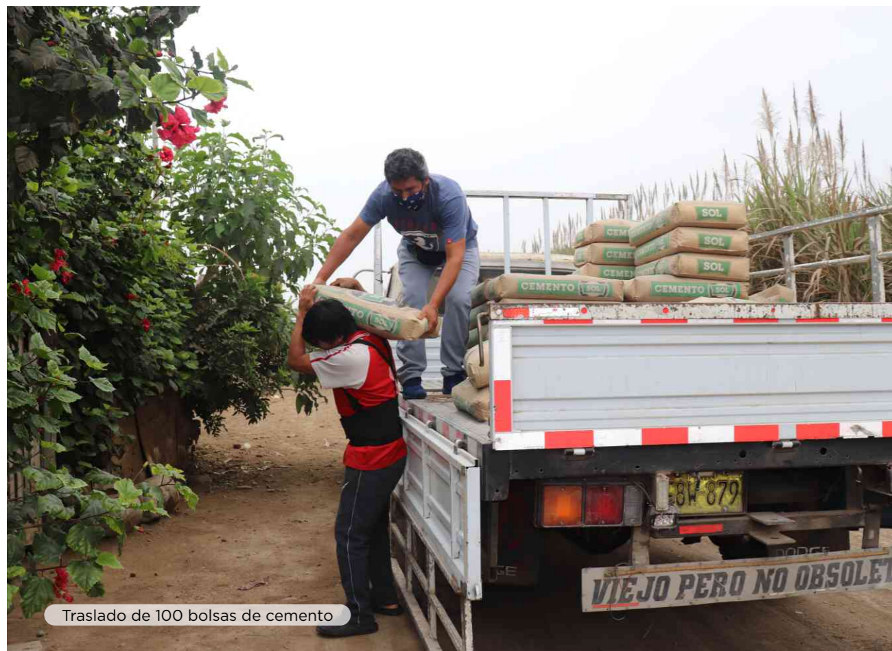
Traslado de 100 bolsas de cemento

Con donación de 100 bolsas de cemento para su losa deportiva y maquinaria para facilitar acceso entre comités