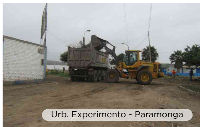
Urb. Experimento - Paramonga