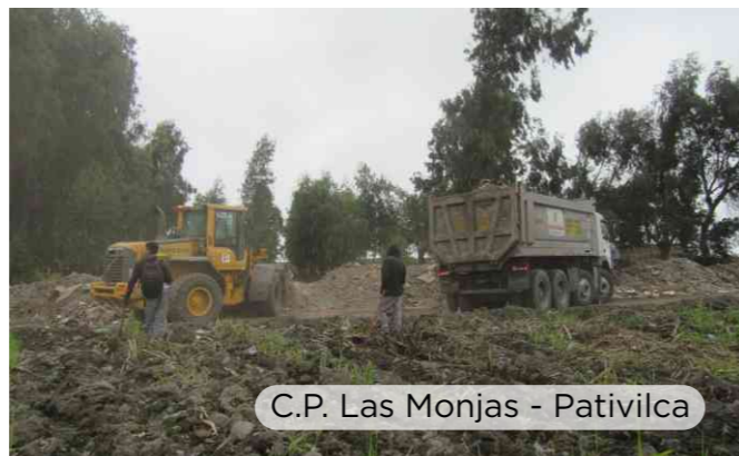
C.P. Las Monjas - Pativilca

Es importante resaltar que estas acciones forman parte de nuestro Programa de Adecuación y Manejo Ambiental (PAMA), el cual venimos desarrollando con la participación de la comunidad y autoridades correspondientes. A la vez, invocamos a la población a realizar una correcta disposición de sus residuos o esperar al carro recolector para evitar que se acumulen grandes cantidades de residuos que pueden ser perjudiciales para la salud.