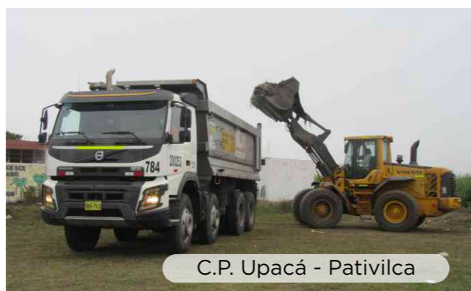
C.P. Upacá - Pativilca