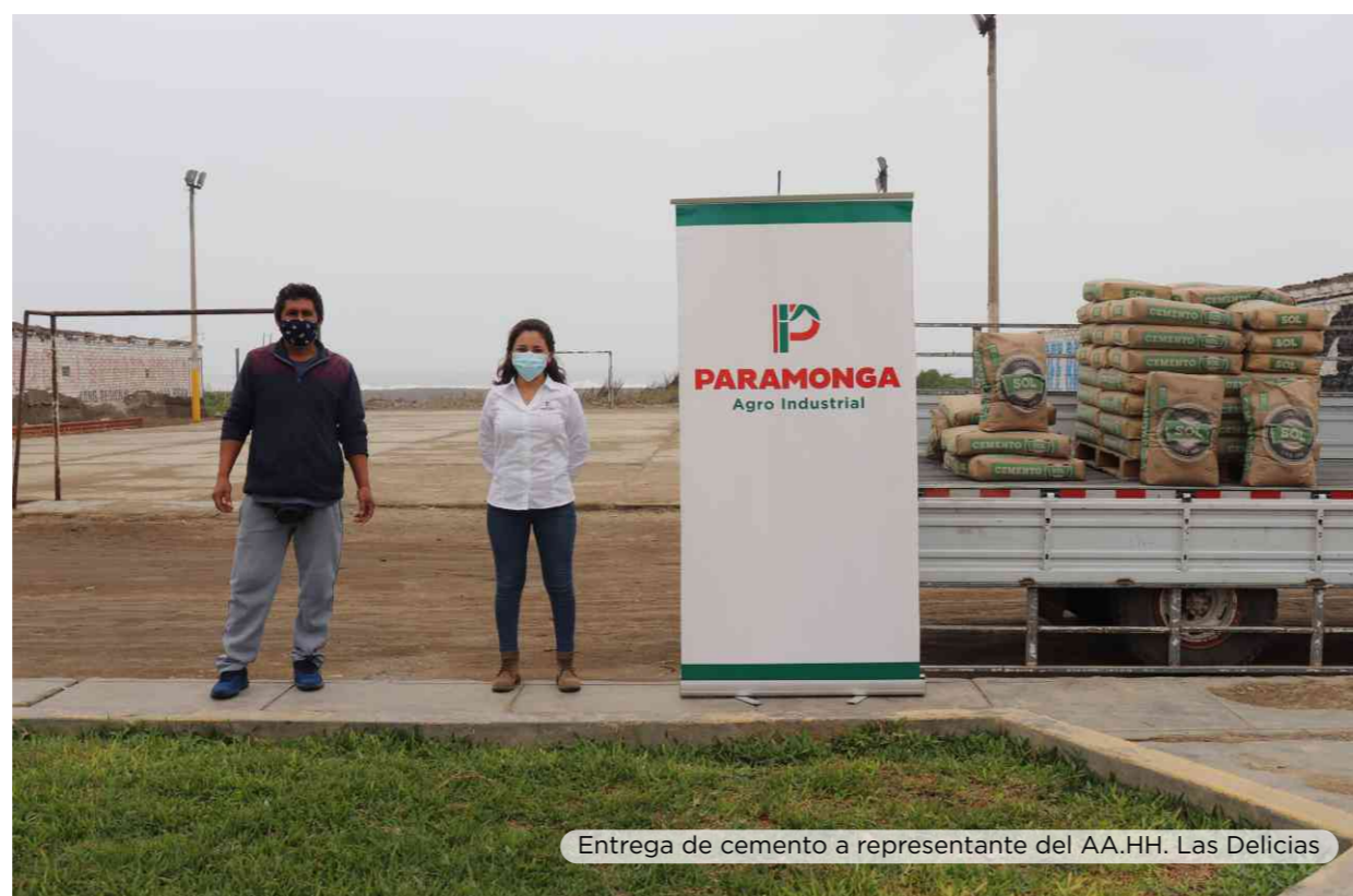
Entrega de cemento a representante del AA.HH. Las Delicias

Por ello, donamos por segunda oportunidad 50 bolsas de cemento, haciendo hasta ahora un total de 100 bolsas entregadas para la renovación de su losa deportiva, la cual se encontraba deteriorada por el paso del tiempo y ponía en riesgo la integridad física de los vecinos.