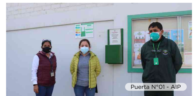
Puerta N°01 - AIP