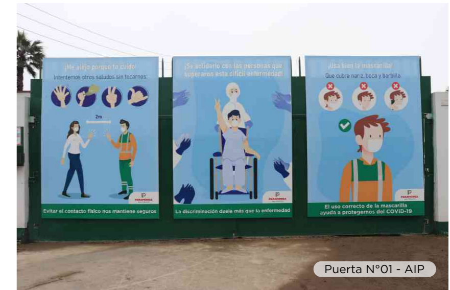
Puerta N°01 - AIP

Además, quisimos compartir esta información también con la comunidad, por ello ubicamos estratégicamente cinco paneles con contenido informativo en el cruce de la Avenida Central y la calle Bolívar del distrito de Paramonga, zona por donde circulan vehículos y personas a quienes nos dirigimos a través de estos mensajes esperando que