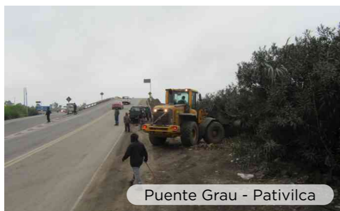
Puente Grau - Pativilca