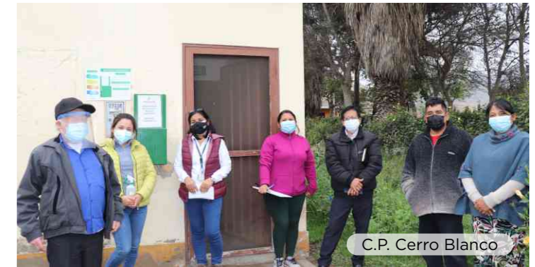
C.P. Cerro Blanco