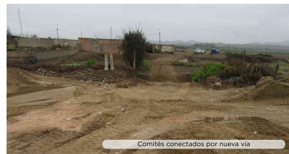
Comités conectados por nueva vía