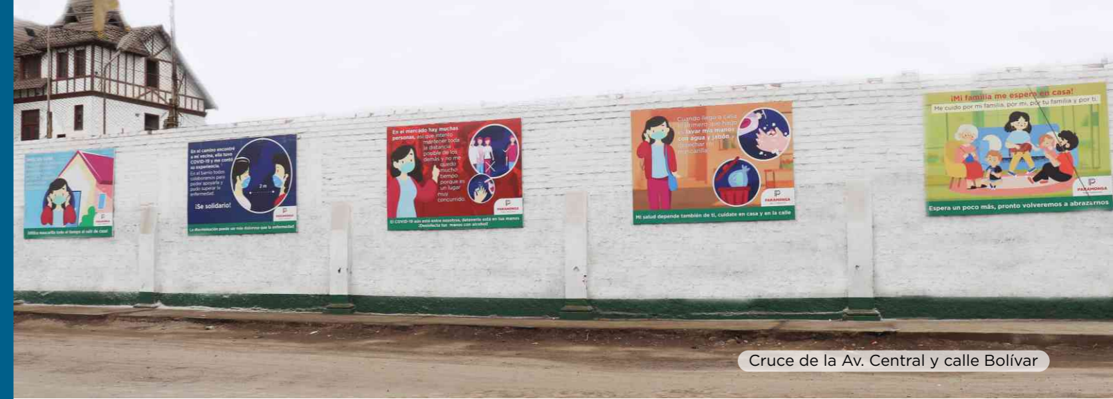
Cruce de la Av. Central y calle Bolívar