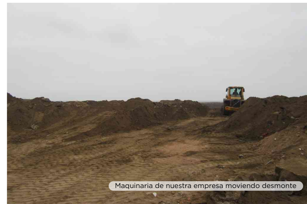
Maquinaria de nuestra empresa moviendo desmonte

Resaltamos la gran labor que vienen realizando los pobladores de este asentamiento humano y su compromiso de fomentar la actividad deportiva entre niños, jóvenes y adultos, la cual se reanudará según las disposiciones del Gobierno.