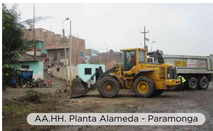
AA.HH. Planta Alameda - Paramonga