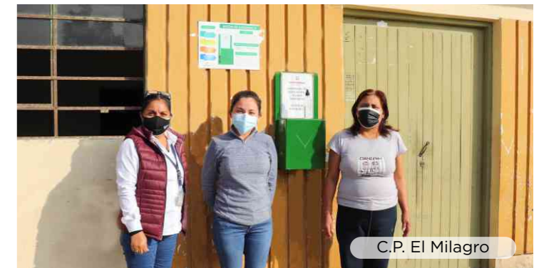
C.P. El Milagro