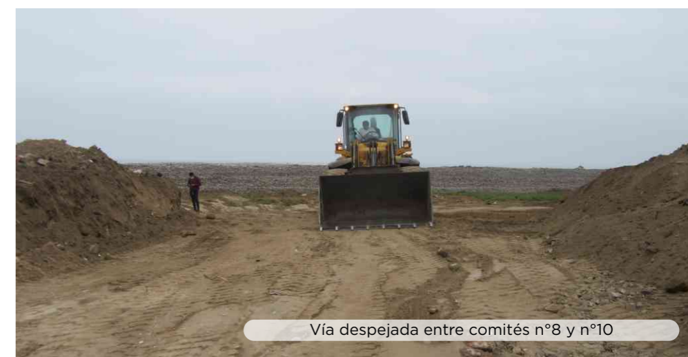
Vía despejada entre comités n°8 y n°10

Continuamos apoyando a la comunidad a través del área de Relaciones Comunitarias y en esta ocasión atendimos las diversas solicitudes de la Junta Directiva del A.H. Las Delicias, con quienes tenemos una buena comunicación y coordinación constante, esto sin duda gracias a la buena organización de la directiva, vecinos y por nuestra parte, voluntad de aportar en el desarrollo de la comunidad.