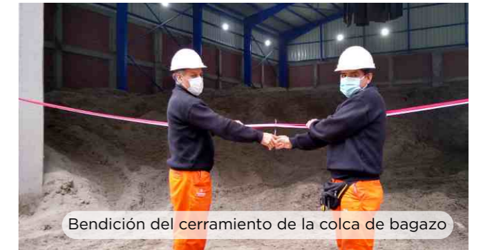
Bendición del cerramiento de la colca de bagazo