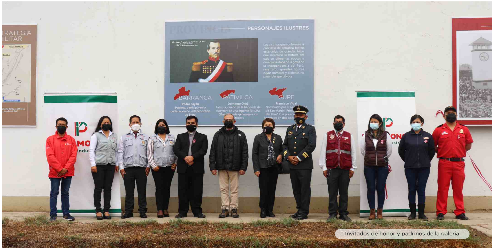
Invitados de honor y padrinos de la galería