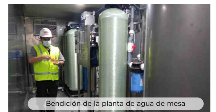
Bendición de la planta de agua de mesa