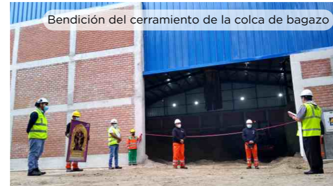
Bendición del cerramiento de la colca de bagazo