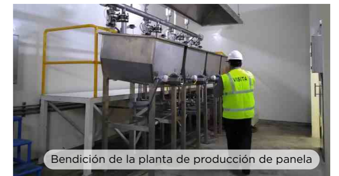
Bendición de la planta de producción de panela