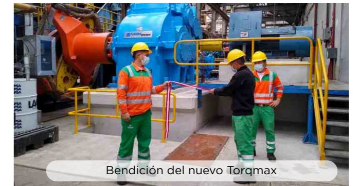
Bendición del nuevo Torqmax