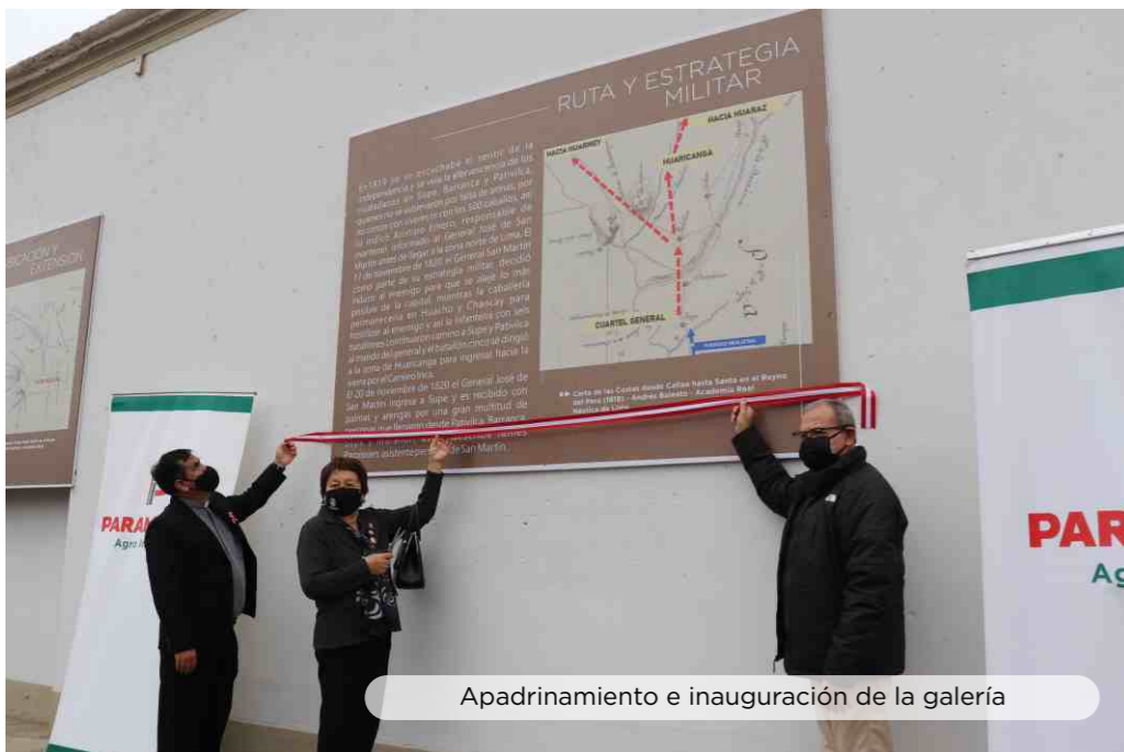
Apadrinamiento e inauguración de la galería