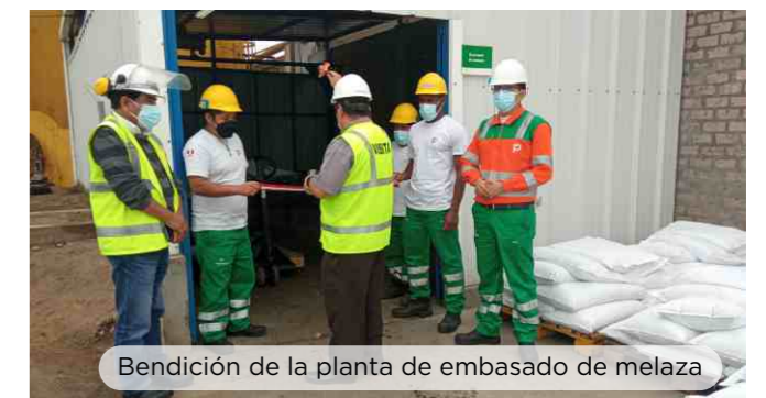
Bendición de la planta de emvasado de melaza