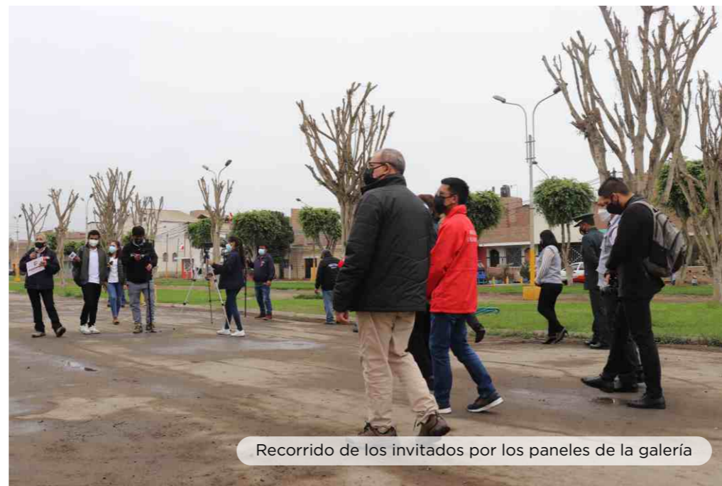
Recorrido de los invitados por los paneles de la galería

Continuando con el homenaje al Perú por el bicentenario de su independencia, realizamos la inauguración de la galería “Paramonga en el Bicentenario: Historia, tradición y dulzura”, con ocho paneles que contienen valiosa información sobre la participación del distrito de Paramonga durante la gesta de independencia, su estratégica ubicación, así como de los personajes ilustres de la Provincia de Barranca y lugares tradicionales que forman parte de su historia.