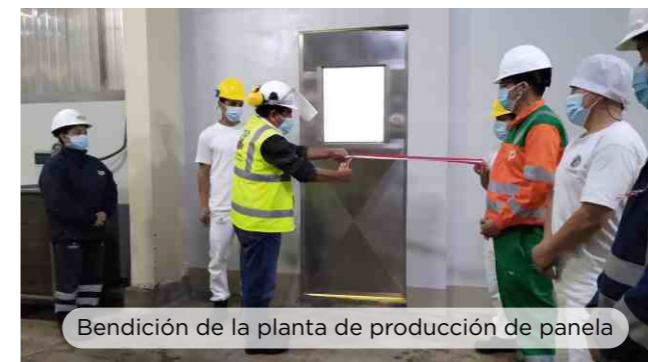
Bendición de la planta de producción de panela