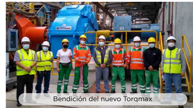
Bendición del nuevo Torqmax