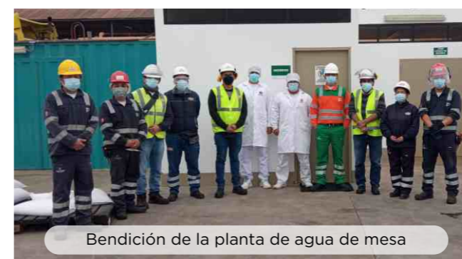
Bendición de la planta de agua de mesa