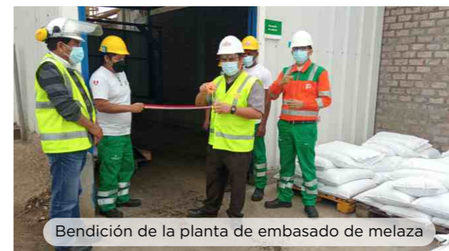
Bendición de la planta de emvasado de melaza