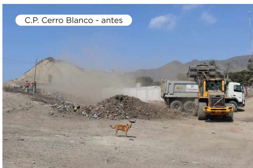
C.P. Cerro Blanco - antes