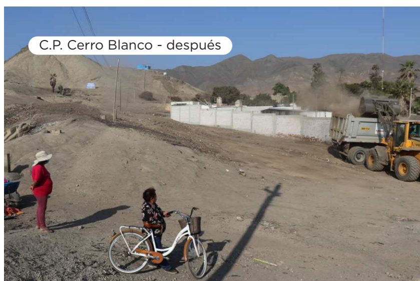
C.P. Cerro Blanco - después

Reafirmamos nuestra esencia como empresa social y ambientalmente responsable y desarrollamos una ardua jornada de limpieza de residuos y desmote en diferentes puntos de Paramonga y del centro poblado de Cerro Blanco, actividad que forma parte de nuestro programa de "Adecuado manejo de residuos sólidos" comprendido en nuestro Programa de Adecuación y Manejo Ambiental (PAMA).