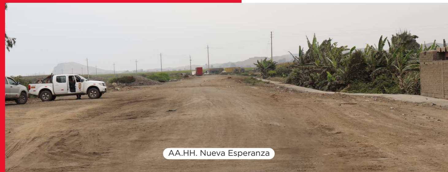
AA.HH. Nueva Esperanza

Es importante resaltar que esta es la segunda jornada de limpieza que se realiza este año y es una actividad que beneficia a toda la comunidad, ya que elimina posibles focos infecciosos, evitando la proliferación de enfermedades causadas por la acumulación de estos residuos. A la vez, exhortamos a los vecinos de estas zonas a mantener estos espacios limpios y hacer una correcta disposición de residuos, depositándolos en los contenedores más cercanos.