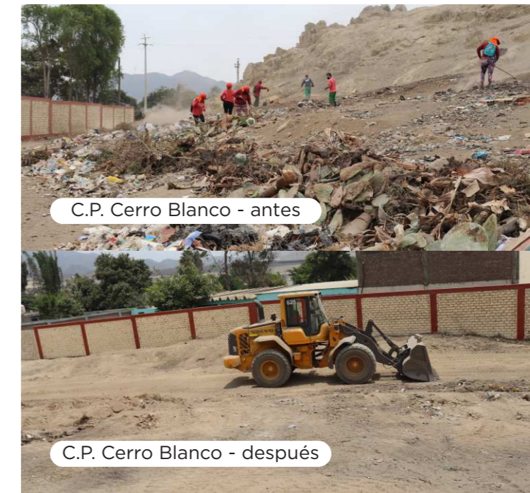
C.P. Cerro Blanco - antes