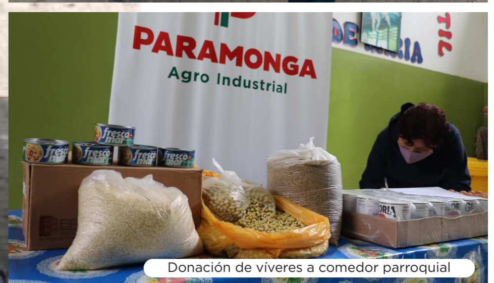
Donación de víveres a comedor parroquial