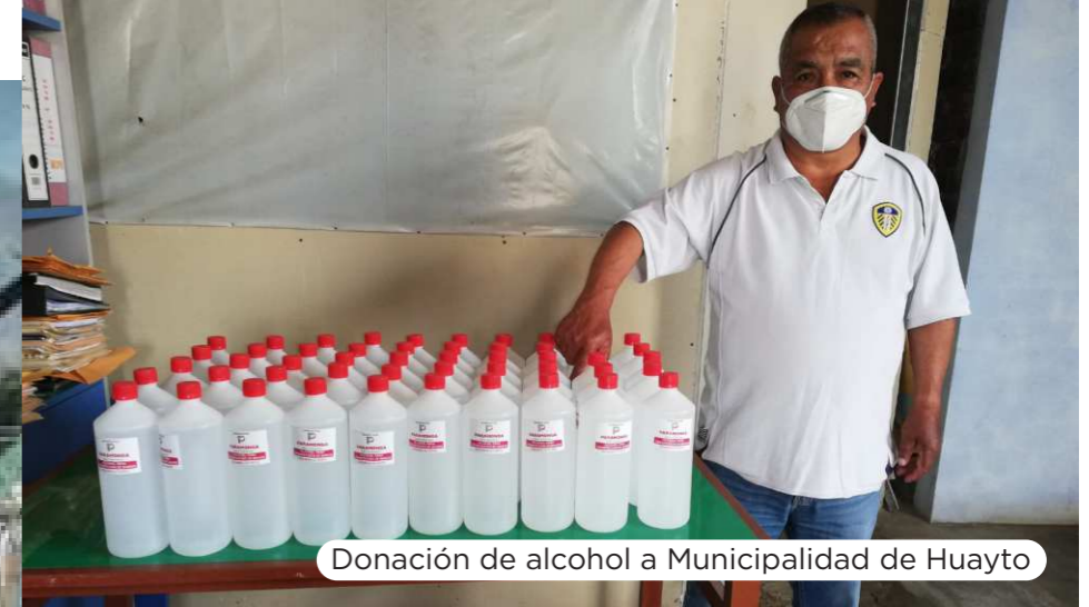
Donación de alcohol a Municipalidad de Huayto