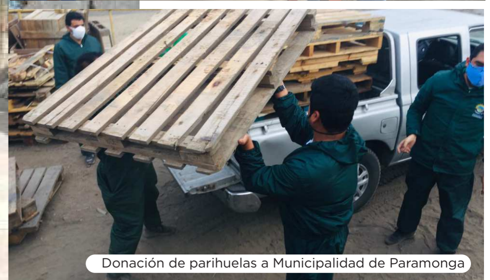
Donación de parihuelas a Municipalidad de Paramonga