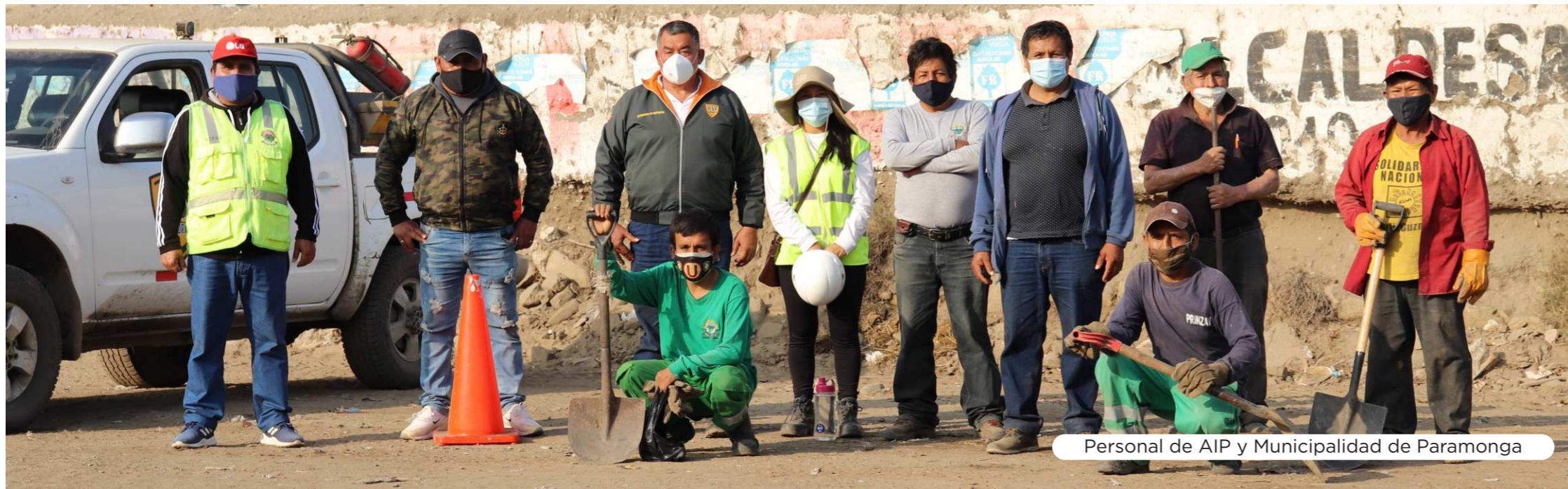
Personal de AIP y Municipalidad de Paramonga