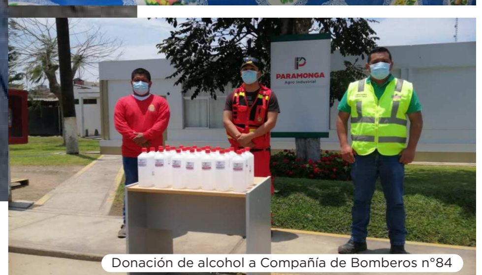
Donación de alcohol a Compañía de Bomberos n°84